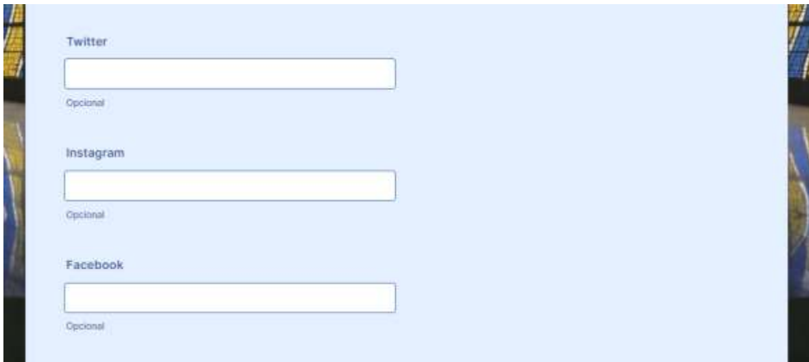
Figura 10. Interfaz para ingresar datos que identifican la opción electoral en redes sociales