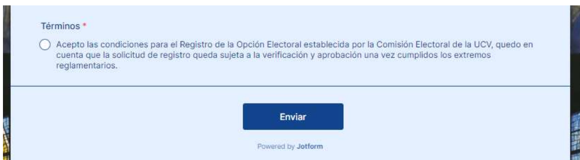
Figura 14. Interfaz para aceptar los términos y enviar la solicitud del registro de opciones electoral