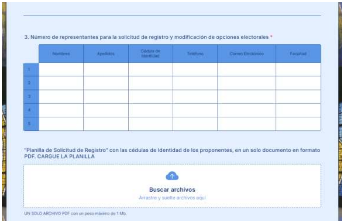
Figura 8. Interfaz para ingresar identificación de los representantes de la opción electoral y cargar la planilla de solicitud de registro