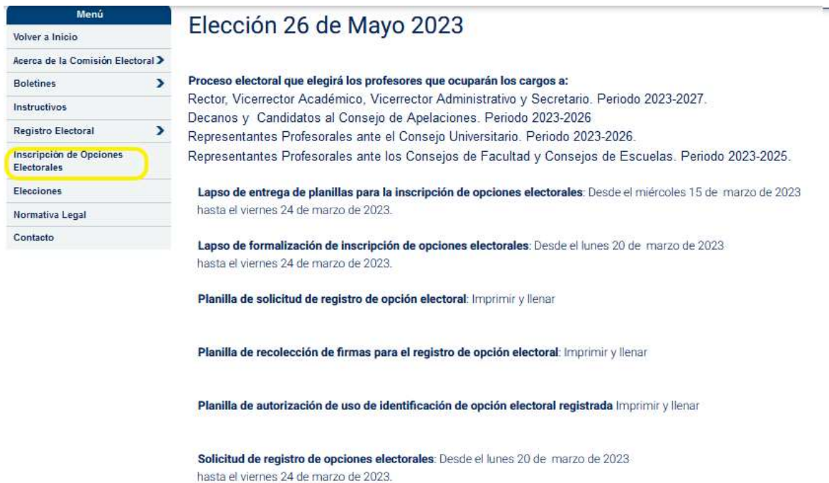
Figura 5. Interfaz de Inscripción de opciones electorales en página web de la Comisión Electoral

http://www.ucv.ve/organizacion/consejo-universitario/comision-electoral-ucv/inscripcion-de-opciones-electorales.html