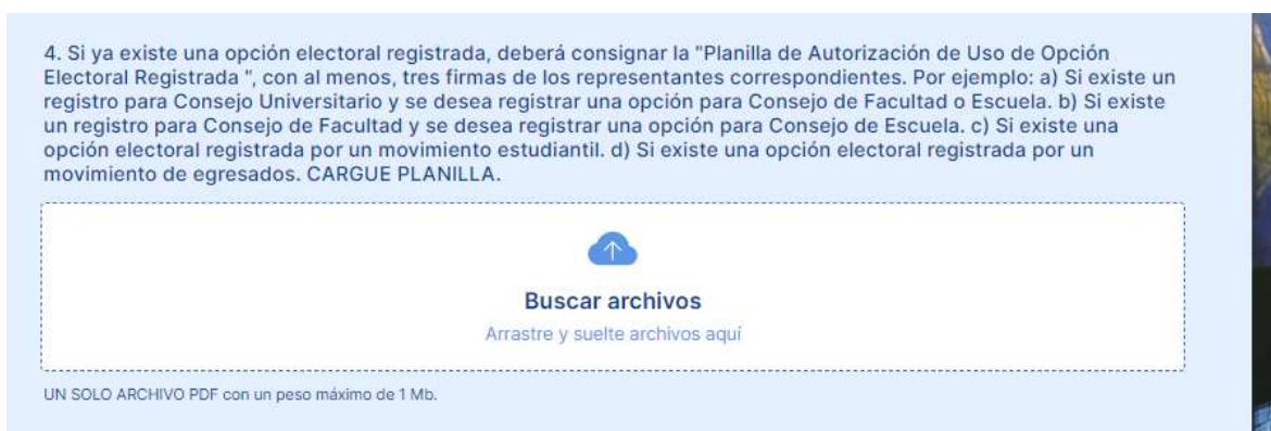
Figura 9. Interfaz para ingresar la planilla de autorización de uso de identificación de la opción electoral