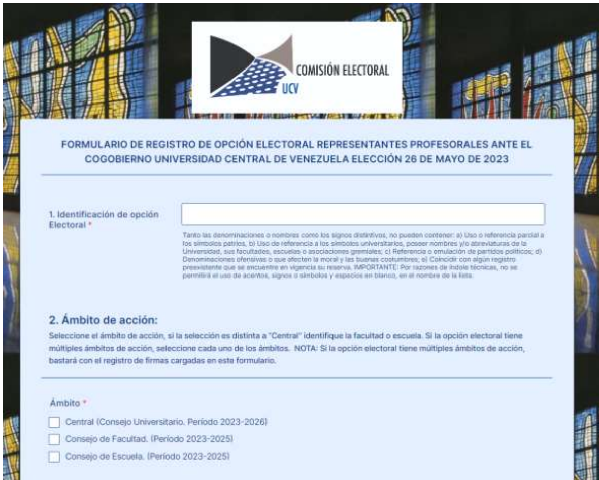
Figura 6. Interfaz para ingresar identificación y ámbito de acción de la opción electoral